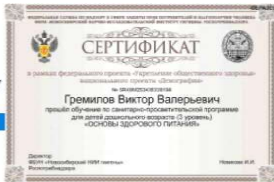
Рис. 15. – Просмотр результатов итогового тестирования и получение сертификата, подтверждающего успешность прохождения обучения

В случае если набрано менее 80% правильных ответов, Программа указывает проблемные разделы и предлагает пройти тестирование повторно. Количество повторных тестирований не ограничено по количеству, но ограничено по времени. Повторное тестирование можно пройти не ранее чем через 24 часа от предыдущего тестирования.