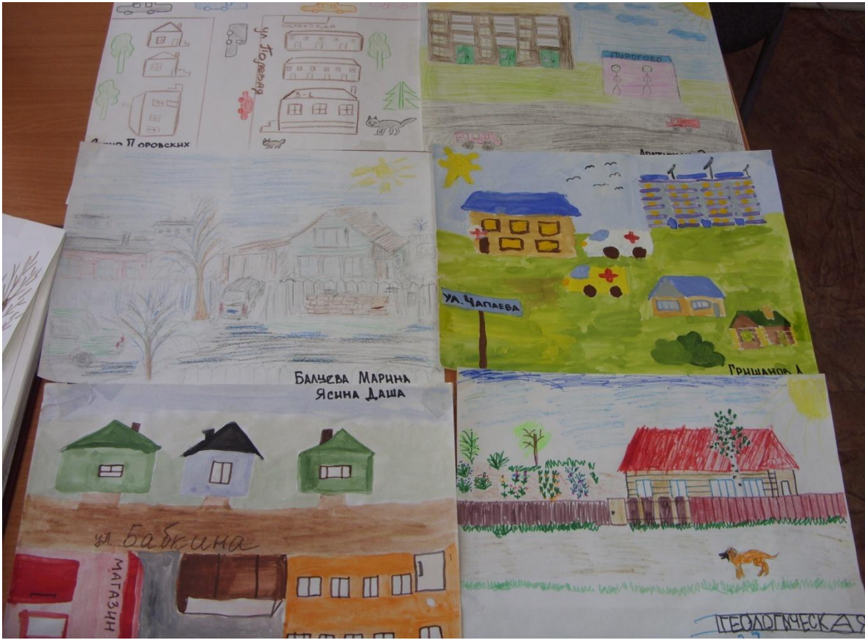
Рисунки «Моя улица»